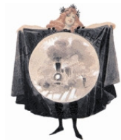
ASSOCIAZIONE MUSEO NAZIONALE DEL CINEMA