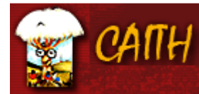
Caith Centro Yanapanakusun