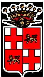
Patrocinio del Comune di Chieri