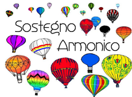
Associazione di promozione sociale Sostegno Armonico