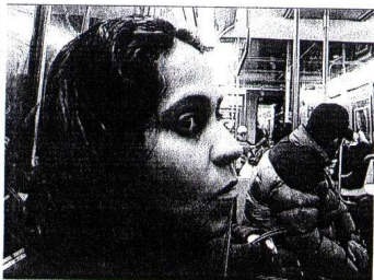
«Il volto segreto della paura» di Cerasuolo e Fergnatchio

«Panoramica doc» è la sezione che il Piemonte Movie dedica ai documentari realizzati nel 2008 nella nostra regione. Vi fanno parte cinquantatré lavori tra cui undici anteprime di documentari sostenuti dal Piemonte Doc Film Fund. Questa sotto-sezione s'intitola «Anteprime Piemonte Doc FilmFund», è a cura di Maurizio Fedele e comprende, oltre a «Medusa» di Fredo Valla che ha inaugurato la manifestazione, titoli come «Il volto nascosto della paura» di Enrico Cerasuolo e Sergio Fergnatchio, «Mostar United» di Claudia Tosi, «Diario di uno scuro» del Fluid Video Crew, «La montagna magica» di